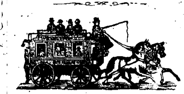
Companhia Ferro Carril da Parahyba